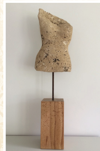
Venus von Toffen

Machen Sie mit, ersteigern Sie diese wundervolle Skulptur und unterstützen Sie das Projekt! Sie können den Talon nutzen, um Ihr Preisangebot bei uns abzugeben oder melden Sie sich einfach per E-Mail oder Telefon bei uns. Gewinner ist die Person, die den höchsten Preis bietet. Der Gewinner wird von uns telefonisch am 8. Juli benachrichtigt.