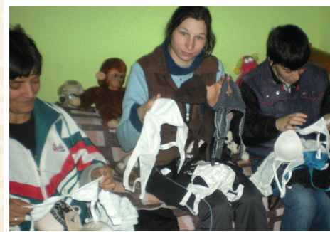
Gespendete BHs werden für den Second-Hand-Markt vorsortiert

Grosse Dinge fangen klein an. So auch das von ora international lancierte Projekt „BH gegen Gewalt“. Ein Jahr ist es jung und unterstützt Frauen in Rumänien, die Gewalt erleben mussten, auf ihrem Weg in ein selbstbestimmtes Leben.