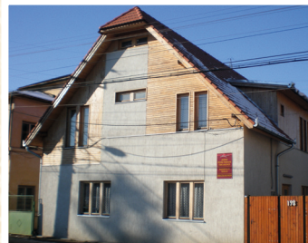
Das Frauenhaus in Gheorgheni

Leider gibt es nur sehr wenige Eingliederungsmassnahmen für Frauen und allein-erziehende Mütter in Rumänien, auch das Thema häusliche Gewalt wird noch sehr stark tabuisiert und verharmlost. In erster Linie soll den Frauen im Frauenhaus daher Schutz geboten werden. Aber: Sie sollen auch mit kleineren Aufgaben und Projek-